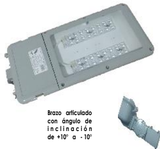
Brazo articulado con ángulo de inclinación de +10° a -10°